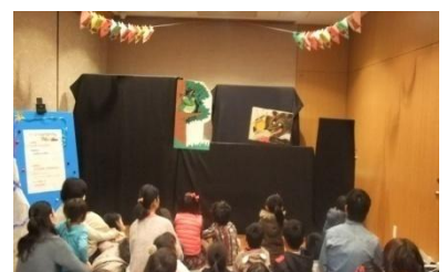
ペープサート「ともだちや」

今年も内容を変えて午前・午後の2回行いました。絵本や紙芝居などを使わない、お話だけで想像を広げる「すばなし」は午前・午後とも行われましたが、小さなお子さんもその独特の世界に聞き入っていました。他にも可愛らしいパネルシアターや迫力あるペープサートなどを皆で楽しみました。初めて参加してくれたお子さんが多かったことはとても嬉しいことでした。