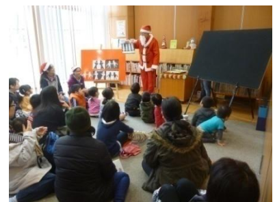
次はなにができるの？サンタさん

ペープサートやパネルシアター、大型絵本の読み聞かせに、初めて見る絵巻物シアターなど見どころたっぷり！サンタさんも登場で切り紙を披露してくれました。夏とクリスマスのおはなし会だけにおこなう工作、今回は「スタンドグラスのクリスマスツリーへの飾り付け」です。今年も大好評で、内容盛りだくさんの楽しいおはなし会になりました。