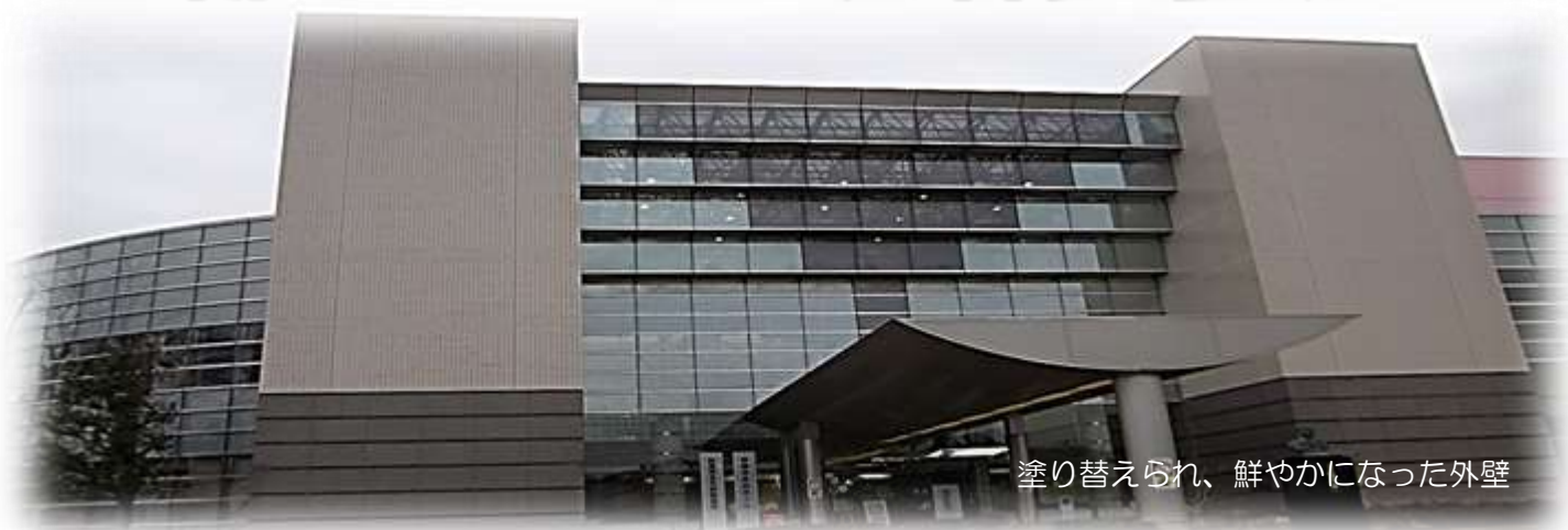
塗り替えられ、鮮やかになった外壁