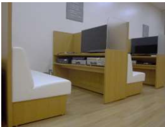
清潔感のあるAVブース。