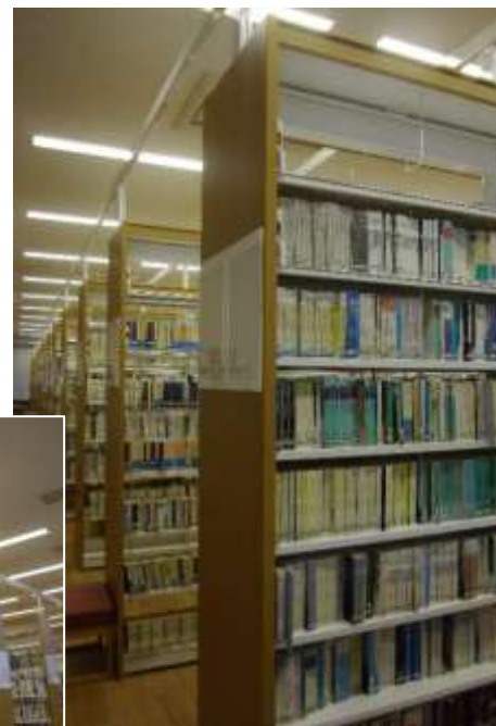
耐震対策を施した 書棚になりました。