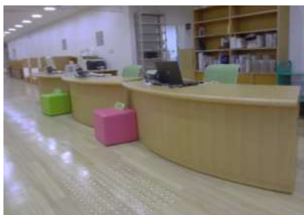
床が明るい色のフローリングになり カウンターも新しくなりました。