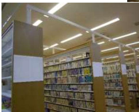
雑誌棚が新しくなりました。